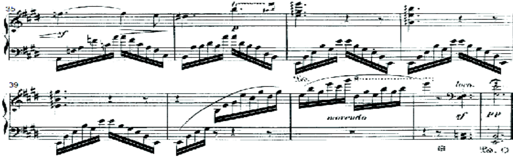
شكل رقم (٣)

أداء أوكتافات هارمونية هابطة في اليد اليمنى ثم صاعدة باستخدام أسلوب الأداء المتصل مع استخدام نغمات أربيجية باليد اليسرى، م (٢٦) أداء أوكتاف هارموني ممتد باستخدام الرباط الزمني مع أداءه في المنطقة الأعلى لوجود 8.....، وأداء أوكتاف هارموني ثم حلية tr.. على الأوكتاف مع أداء نغمات أربيجية باليد اليسرى مع البطء التدريجي في الأداء.