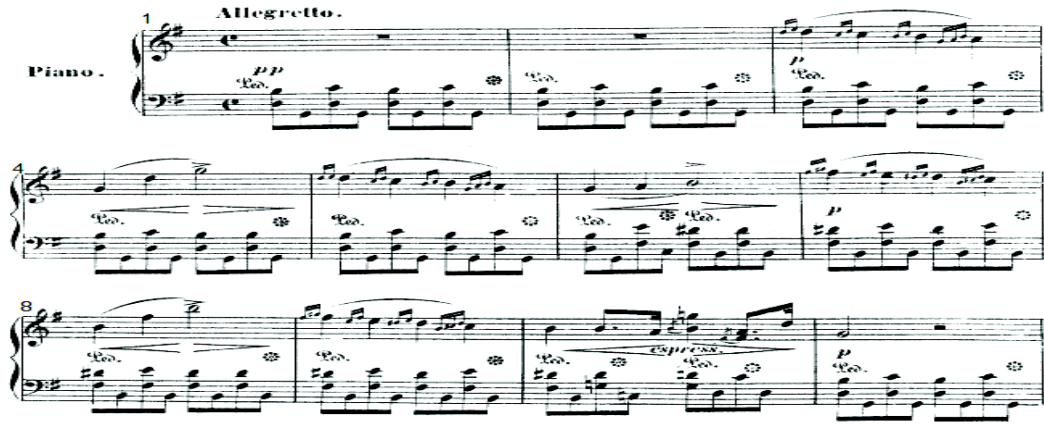
شكل رقم (٩)